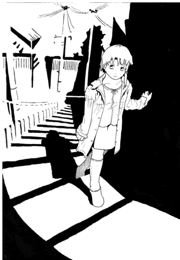
Dibujo: Adrián del Saz

El pequeño León sube a su habitación, en el segundo piso, y se mete en la cama. Se acurruca bajo las mantas y oculta la cabeza bajo la almohada, pero sabe de antemano, porque intenta la misma estrategia cada noche, que será inútil: los ronquidos del borracho suben las escaleras, se cuelan por la rendija de la habitación y entran por los pies en la cama, subiéndole hasta las mismas orejas, entrándole al cerebro y angustiándole el corazón.