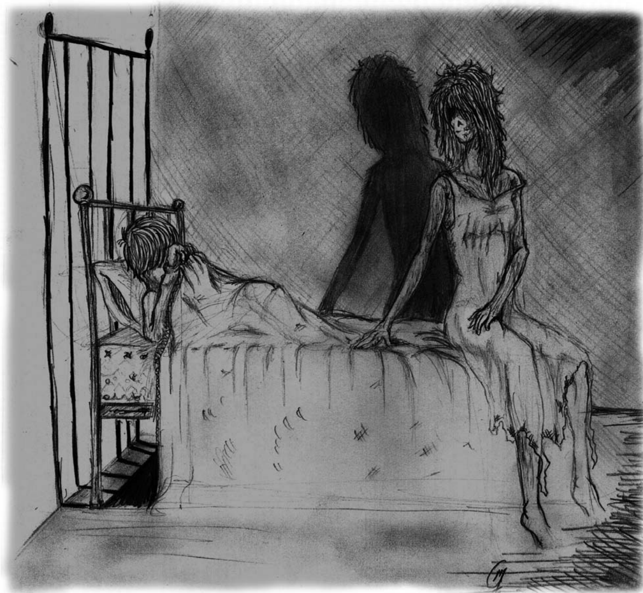
Dibujo: Adrián del Saz